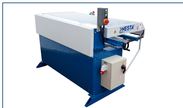
Profileuse à ourlets (détail)