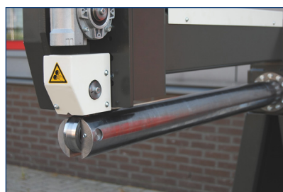
En introduisant le tuyau dans les deux sens, la machine peut agraffer des longueurs de tuyaux allant jusqu'à 2 fois la longueur utile de la machine.