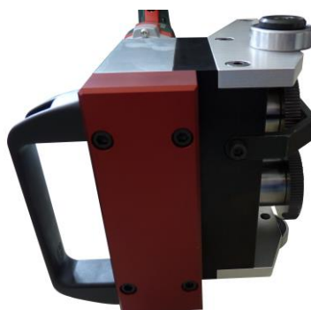
Prise en main et manipulation facilité